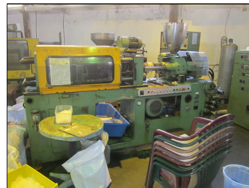
Slika 27 i 28: ANKER A26-120 i KRAUSS MAFFEI MONOMAT 80