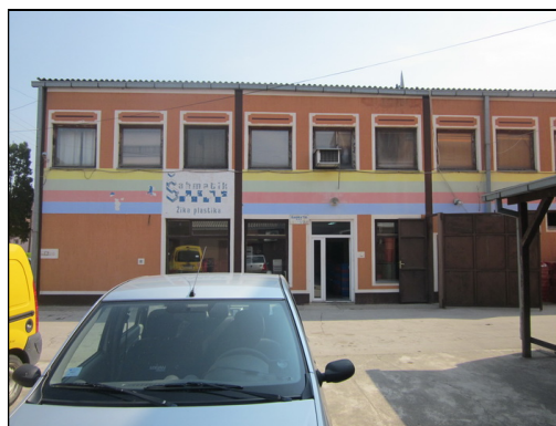
Slika 1 i 2: Poslovni prostor – direkcija – pogled sa ulice i iz dvorišta