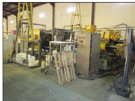
Slika 25 i 26: HAITIAN SA 3200/2250 i SA 3200/2250 i TERMOPLAST 10000kN