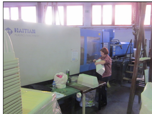
Slika 23 i 24: HAITIAN SA 2500/1000 i SA 3200/2250