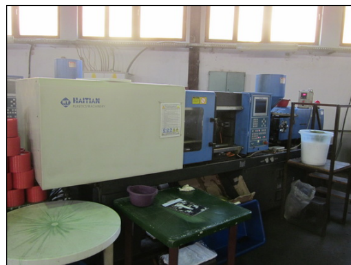
Slika 19 i 20: HAITIAN SA 1200/600 i SA 900/300