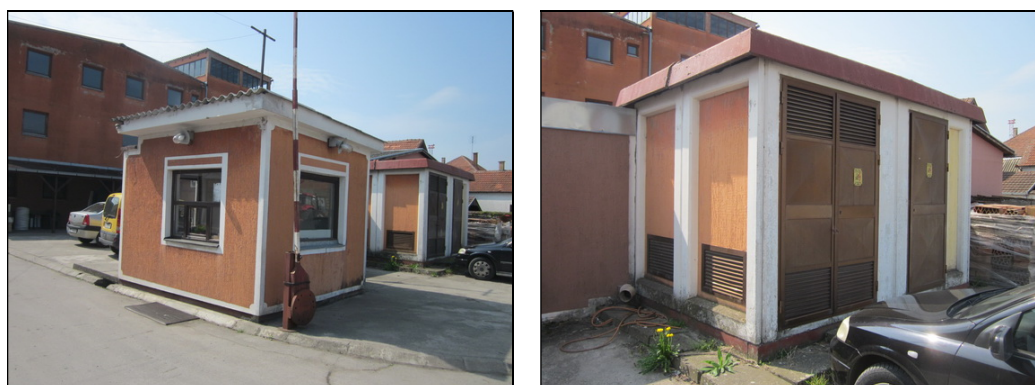
Slika 11 i 12: Portirnica i trafostanica – pogled iz dvorišta i sa ulice

Ceo kompleks ima izgrađenu kompletnu infrastrukturu. Objekti su opremljeni električnom trofaznom strujom, vodovodnom i kanalizacionom instalacijom, centralnim grejanjem, telefonskom instalacijom, gromobranskom i protivpožarnom zaštitom, instalacijama za gas, instalacijama za komprimovani vazduh, u skladu sa namenom svakog objekta.