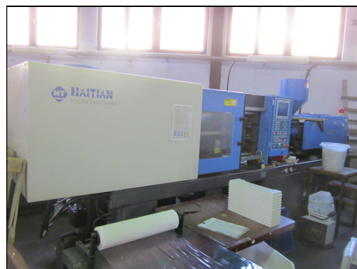
Slika 17 i 18: HAITIAN SA 1600/770 i SA 1200/600