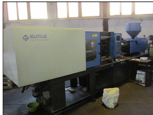
Slika 15 i 16: HAITIAN SA 3800/2950 i SA 1600/770