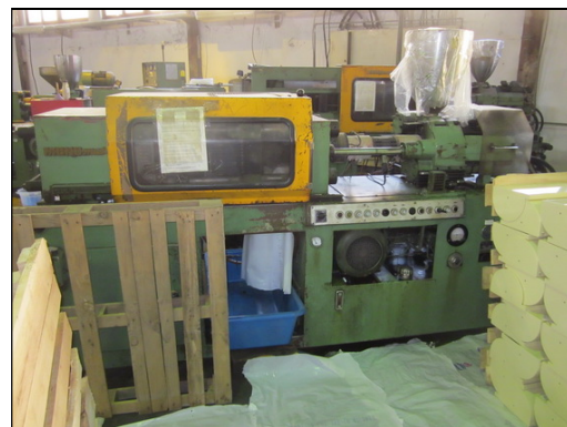
Slika 29 i 30: KRAUSS MAFFEI MONOMAT 165 i MONOMAT 80