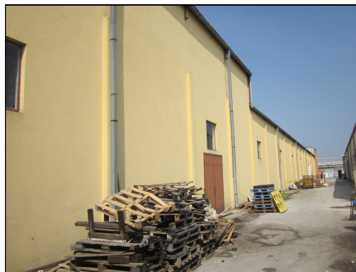
Slika 7 i 8: Poslovno stambeni prostor – pogled sa ulice i iz dvorišta