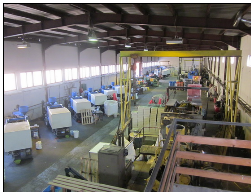
Slika 5 i 6: Proizvodna hala sa radionicom – pogled iz dvorišta i unutrašnji izgled