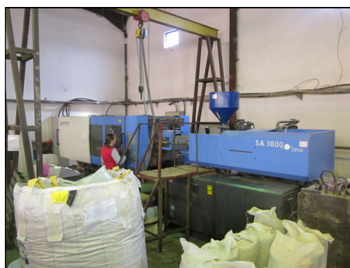
Slika 13 i 14: HAITIAN SA 8000/8400 i SA 3800/2950