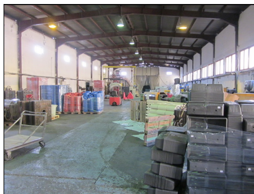
Slika 3 i 4: Proizvodna hala sa radionicom – pogled iz dvorišta i unutrašnji izgled