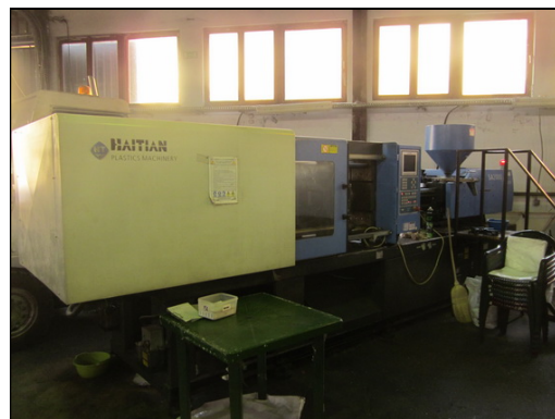
Slika 21 i 22: HAITIAN SA 900/410 i SA 2000/1000