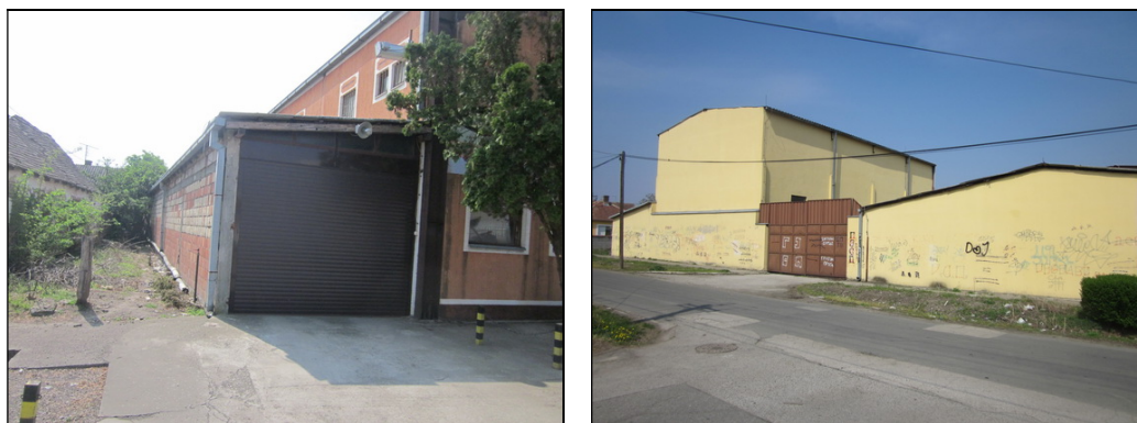
Slika 9 i 10: Magacin sa garažom – pogled sa ulice i pogled na zadnju fasadu